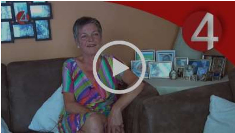
Deze video werd bij de Nijmeegse vierdaagse uitgezonden. Geweldige Awareness voor ADCA en ataxie.

Help ons mee de zorg voor ADCA verder te verbeteren!